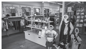
店内レイアウトリニューアル!