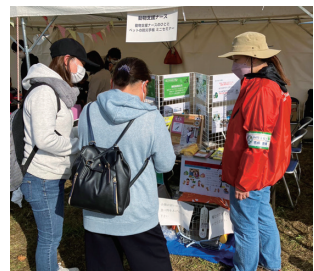
備えるフェスタでの出展参加の様子