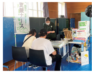
ペット同伴で防災ワークショップ