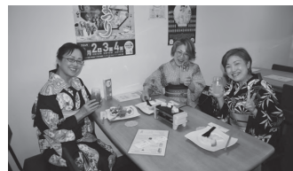
色とりどりの浴衣で乾杯!