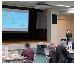
ペットと防災についてのセミナー