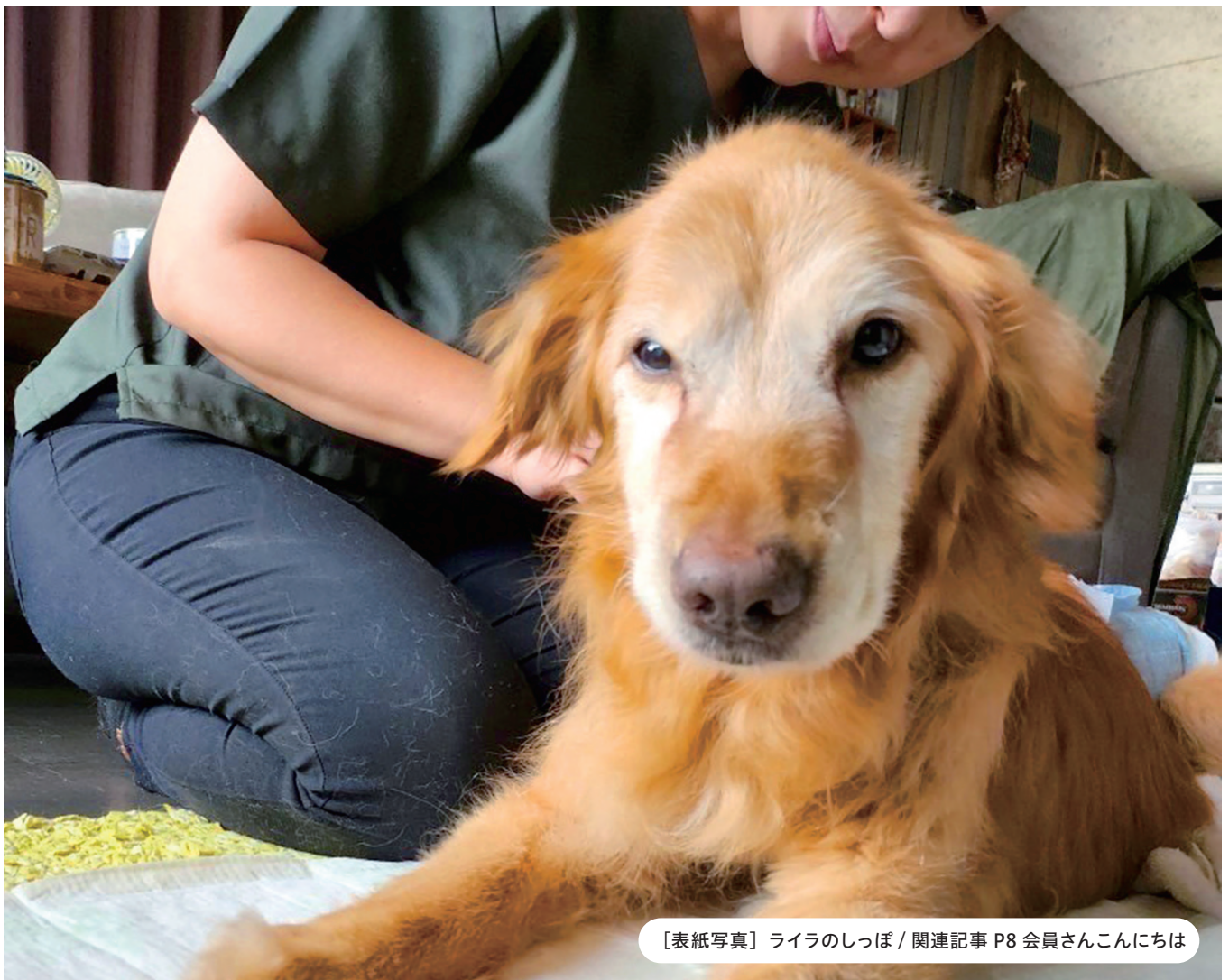
[表紙写真] ライラのしっぽ / 関連記事 P8 会員さんこんにちは