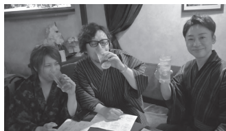
盛り上がってま〜す!