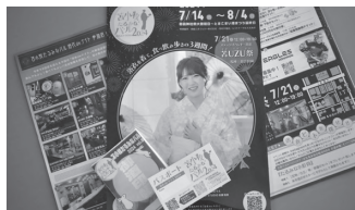
パスポートを購入し準備万端!

イベントへの参加条件は参加店で「パスポート」(1000円)を購入し、「ドレスコード」として浴衣や甚平などの和服を着用すること。各店のイベントメニュー(500円か1000円)を楽しみ、抽選でフェリー往復ペアチケットなどが当たります。