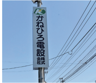
自社の看板照明も自分たちの手で設置