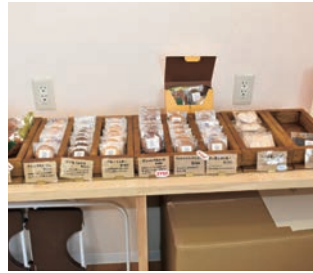
こだわりの焼菓子