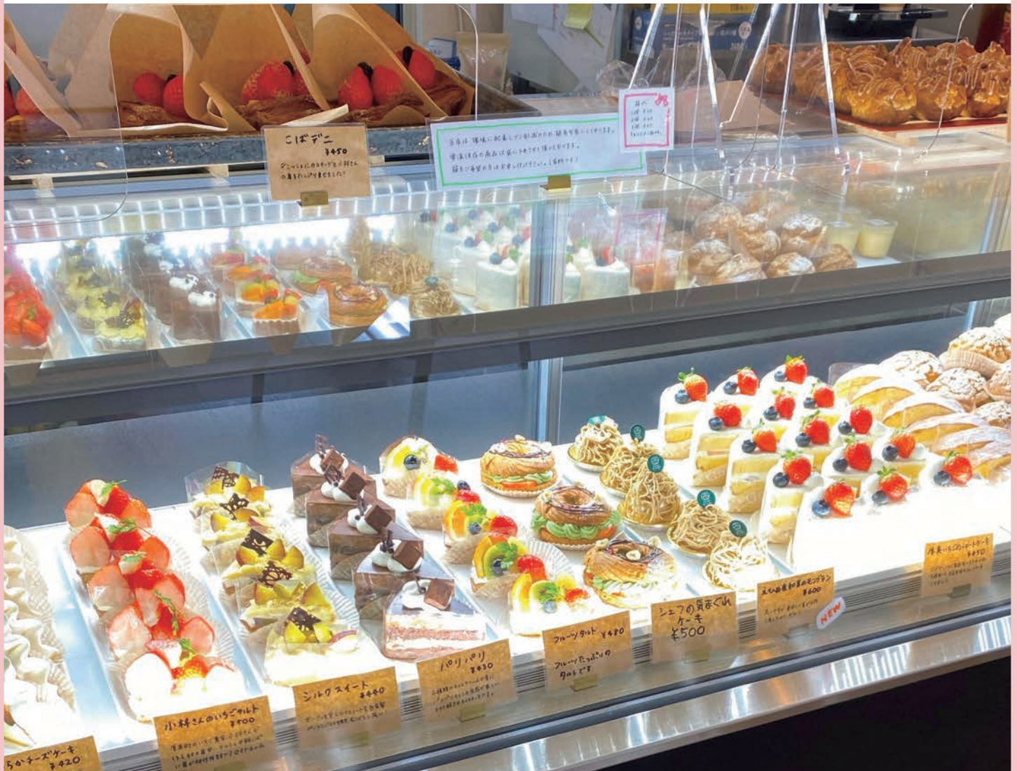
[表紙写真] おかし日和 / 関連記事 P8 会員さんこんにちは