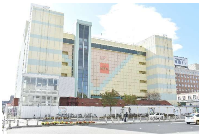
閉鎖から10年余りが経過した旧サンプラザビル